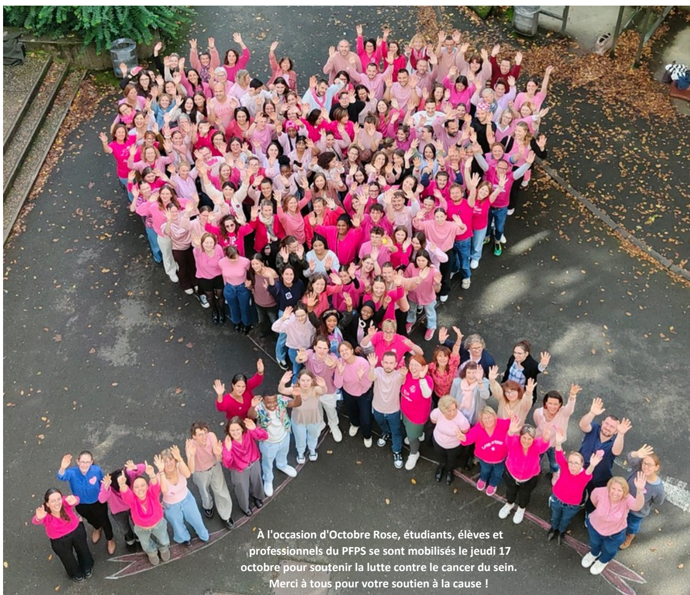
À l'occasion d'Octobre Rose, étudiants, élèves et professionnels du PFPS se sont mobilisés le jeudi 17 octobre pour soutenir la lutte contre le cancer du sein. Merci à tous pour votre soutien à la cause !