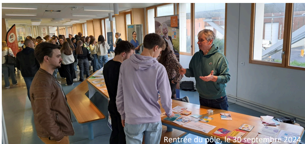
Rentrée du pôle, le 30 septembre 2024